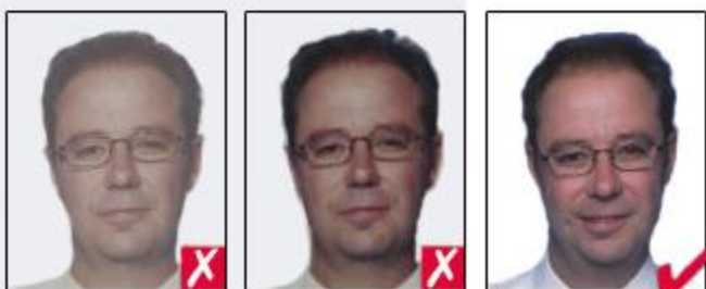
washed out colour