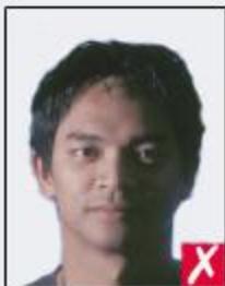
shadows across face