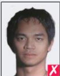
shadows behind head