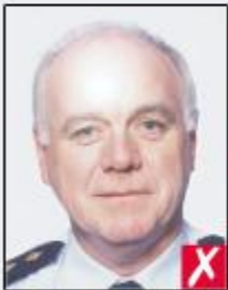
flash reflection on skin