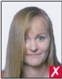
hair across eyes